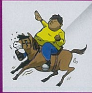
Terlebih naik atau tunggang (kecuali bagi sukan equestrian)