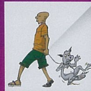
Membiarkan haiwan dirantai dengan tali pendek atau memincangkan kaki haiwan