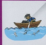
Mengeletrikan atau membunuh racun ke dalam sungai bagi maksud membunuh haiwan.