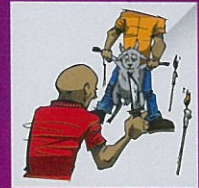
Melapah atau membunuh haiwan kerana kepercayaan karut