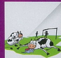
Membiarkan haiwan yang berpenyakit mati di mana-mana tempat