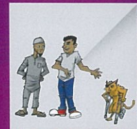
Membuat tawaran jualan haiwan yang sakit