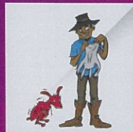
Keluarkan bahagian haiwan yang masih hidup seperti untuk dapatkan kulit, minyak yang boleh menyebabkan kesakitan dan penderitaan pada haiwan