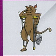
Menyebabkan kesakitan, mencacatkan haiwan