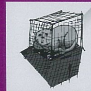
Mengurung haiwan dalam sangkar kecil dan tiada pergerakan