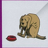
Tidak memberi makan minum kepada haiwan yang dibela