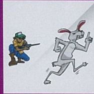
Pertandingan menembak haiwan yang dilepaskan dari kurungan