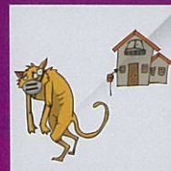
Membiarkan haiwan yang berpenyakit keluar tanpa pengawasan