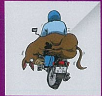
Pengangkutan haiwan yang menyebabkan penderitaan kepada haiwan