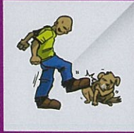
Menyekap, memukul, lebihkan muatan, mendera atau menakutkan haiwan