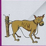
Menyimpan haiwan yang sakit tanpa alasan munasabah